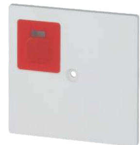
Zentralstück für RT-IP