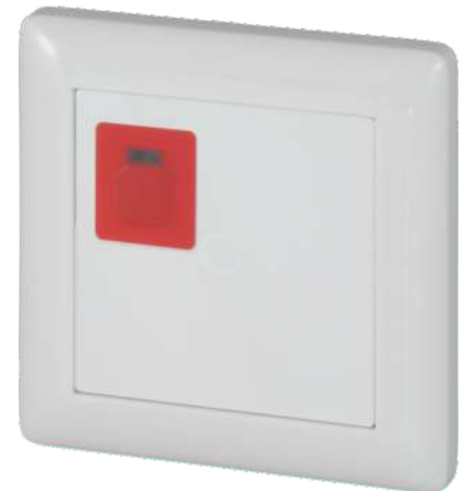
RT-IP mit Rahmen und Zentralstück