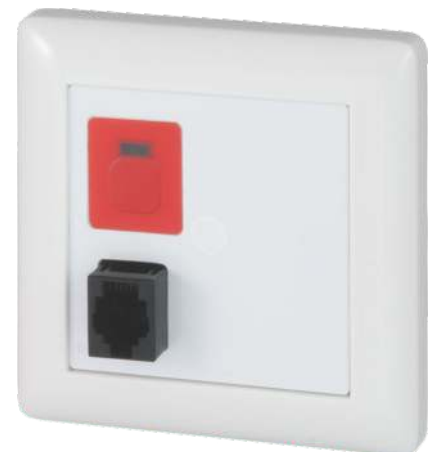
RTN-IP mit Rahmen und Zentralstück