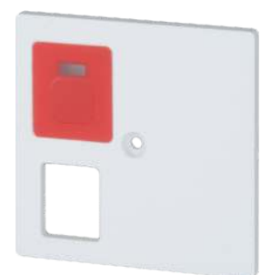
Zentralstück für RTN-IP