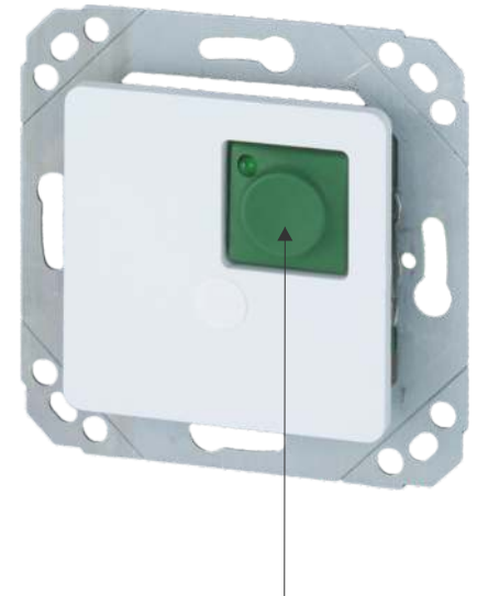
QUITT-Taste / ANW-Taste (mit Beleuchtung)

Im Lieferumfang ist der AT mit Zentralstück. Schalterprogramm Rahmen und Adapter TK müssen separat bestellt werden.